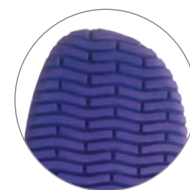
SUOLA ANTISCIVOLO ANTISLIP SOLE